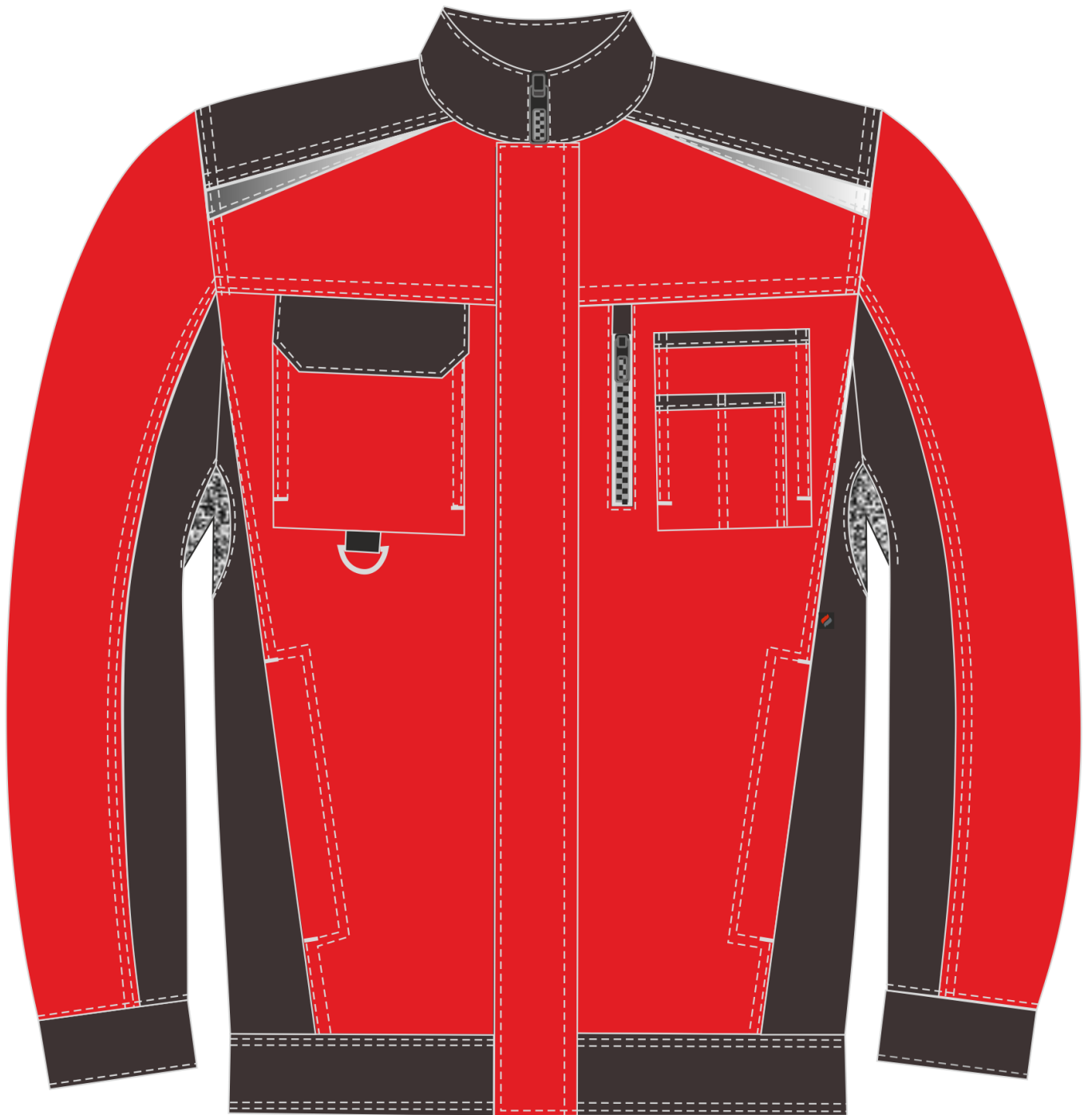
Рис.4. Эскиз Костюм Милан (тк.Карелия,260) брюки, красный/черный. Куртка, вид спереди.