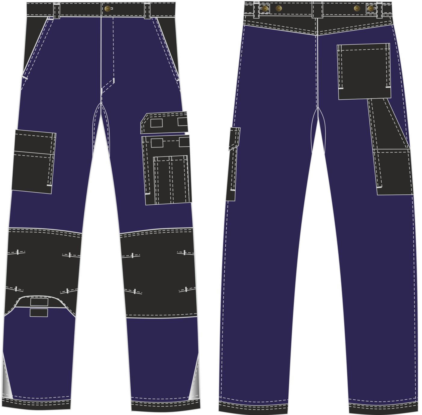
Рис.12. Эскиз Костюм Милан (тк.Карелия,260) брюки, т.синий/черный. Брюки, вид спереди и сзади.