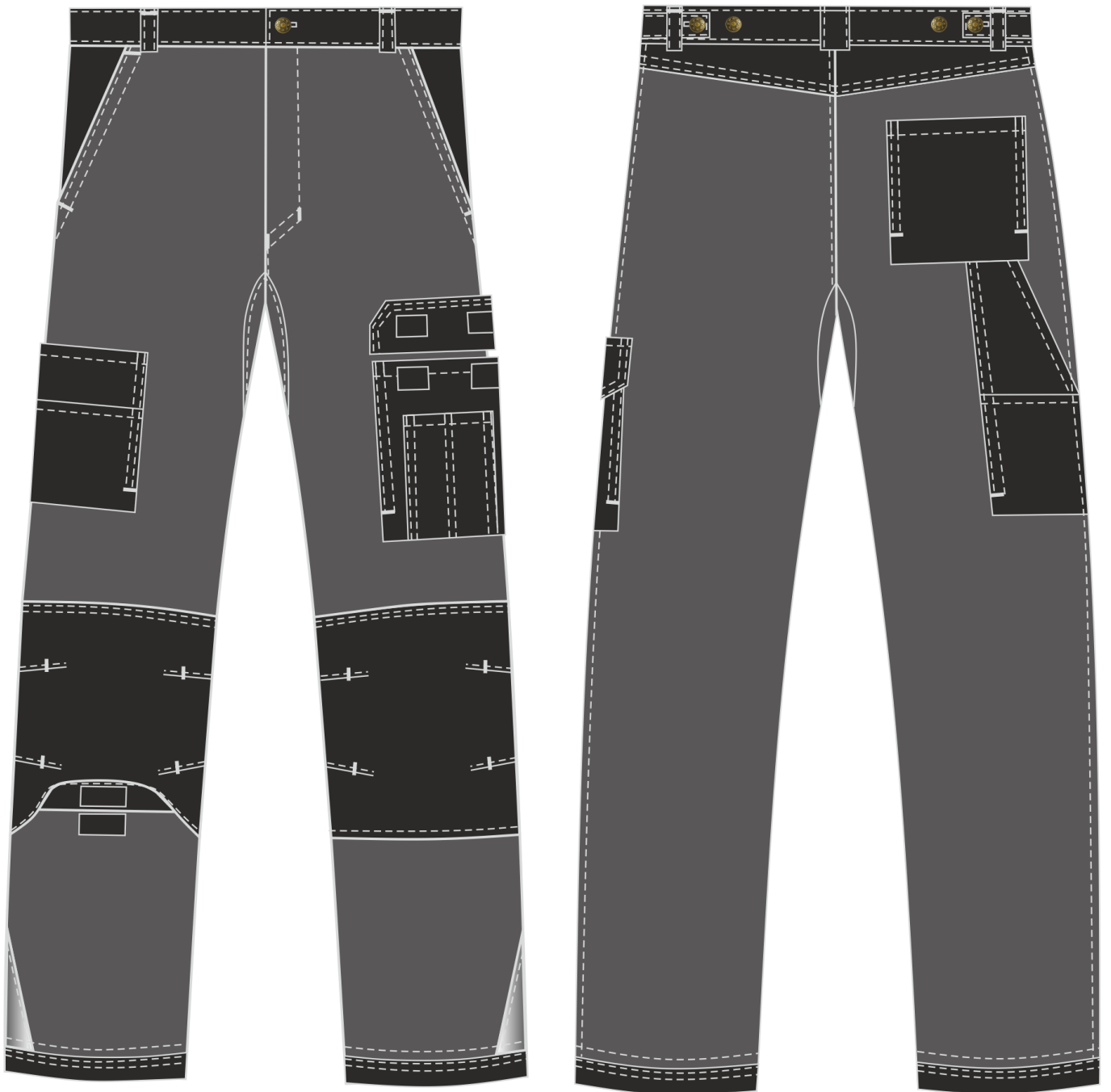
Рис.3. Эскиз Костюм Милан (тк.Карелия,260) брюки, серый/черный, брюки, вид спереди и сзади.