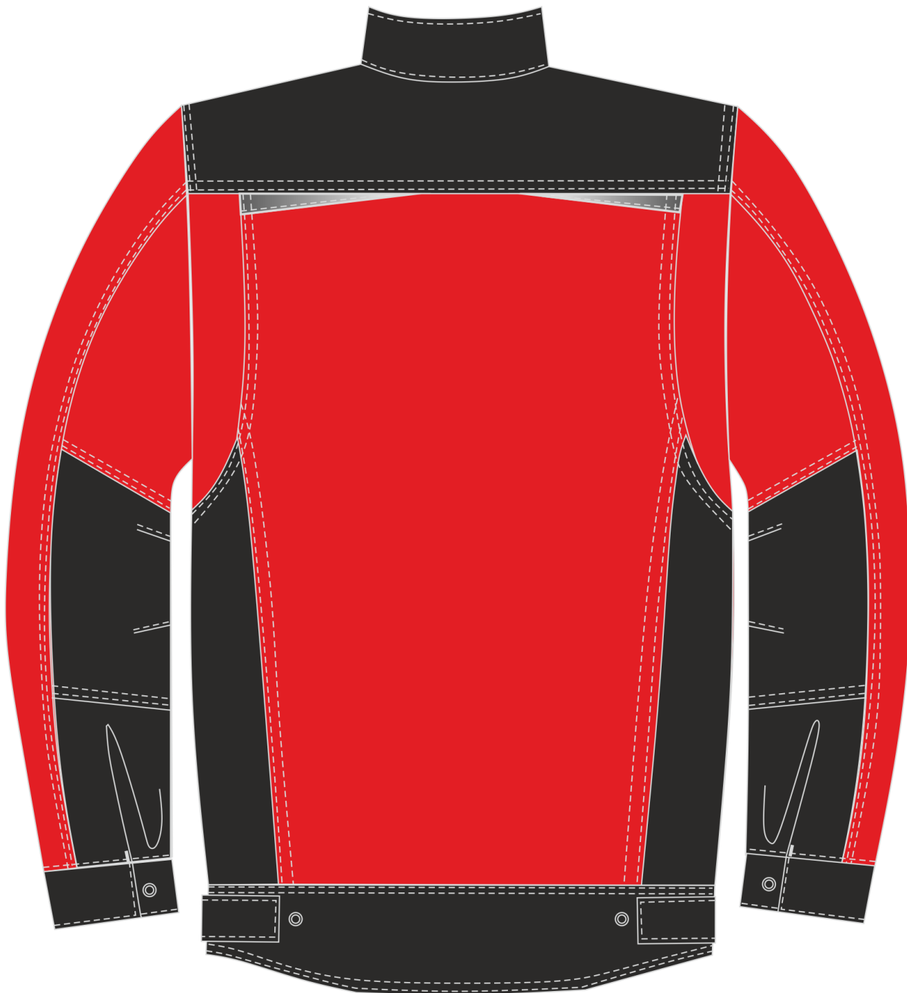
Рис.5. Эскиз Костюм Милан (тк.Карелия,260) брюки, красный/черный. Куртка, вид сзади.