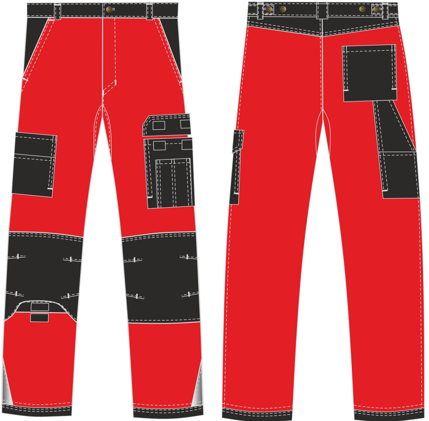
Рис.6. Эскиз Костюм Милан (тк.Карелия,260) брюки, красный/черный. Брюки, вид спереди и сзади.