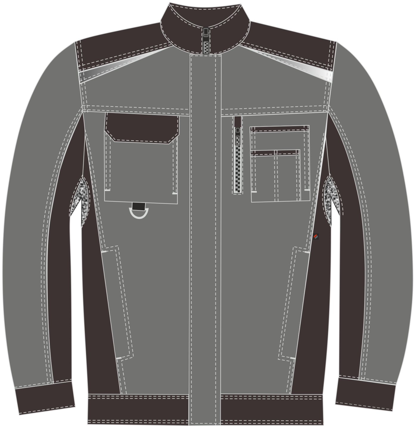
Рис.1. Эскиз Костюм Милан (тк.Карелия,260) брюки, серый/черный, куртка, вид спереди.