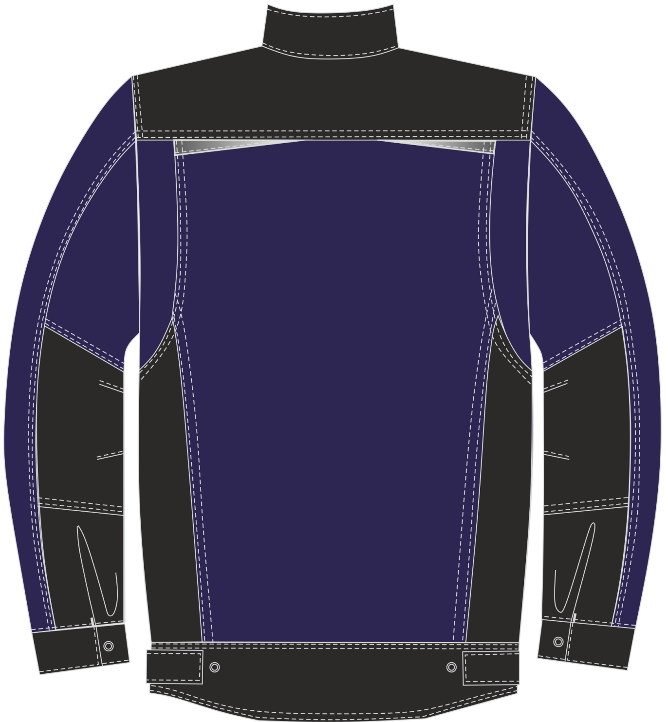
Рис.11. Эскиз Костюм Милан (тк.Карелия,260) брюки, т.синий/черный. Куртка, вид сзади.