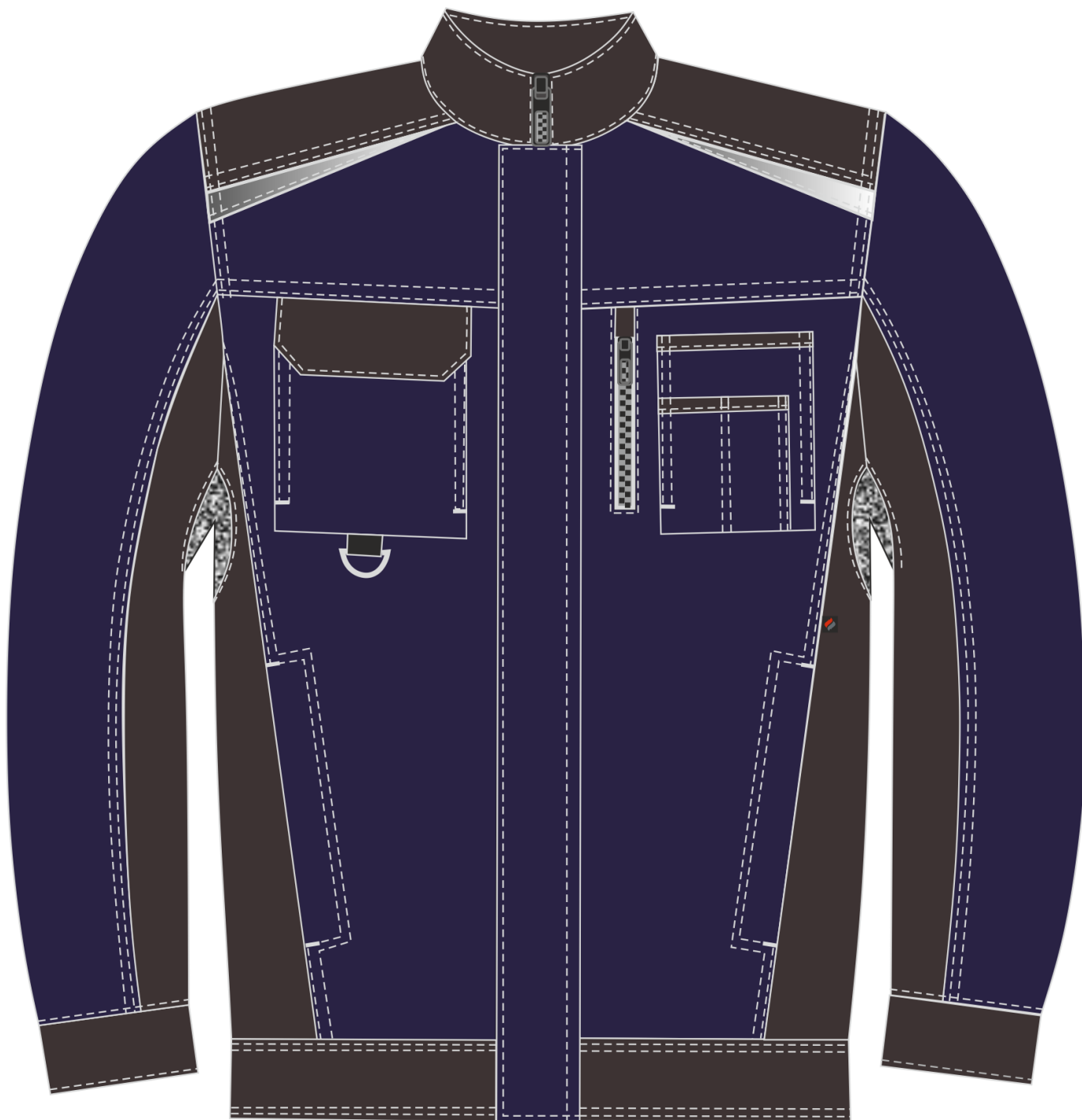
Рис.10. Эскиз Костюм Милан (тк.Карелия,260) брюки, т.синий/черный. Куртка, вид спереди.