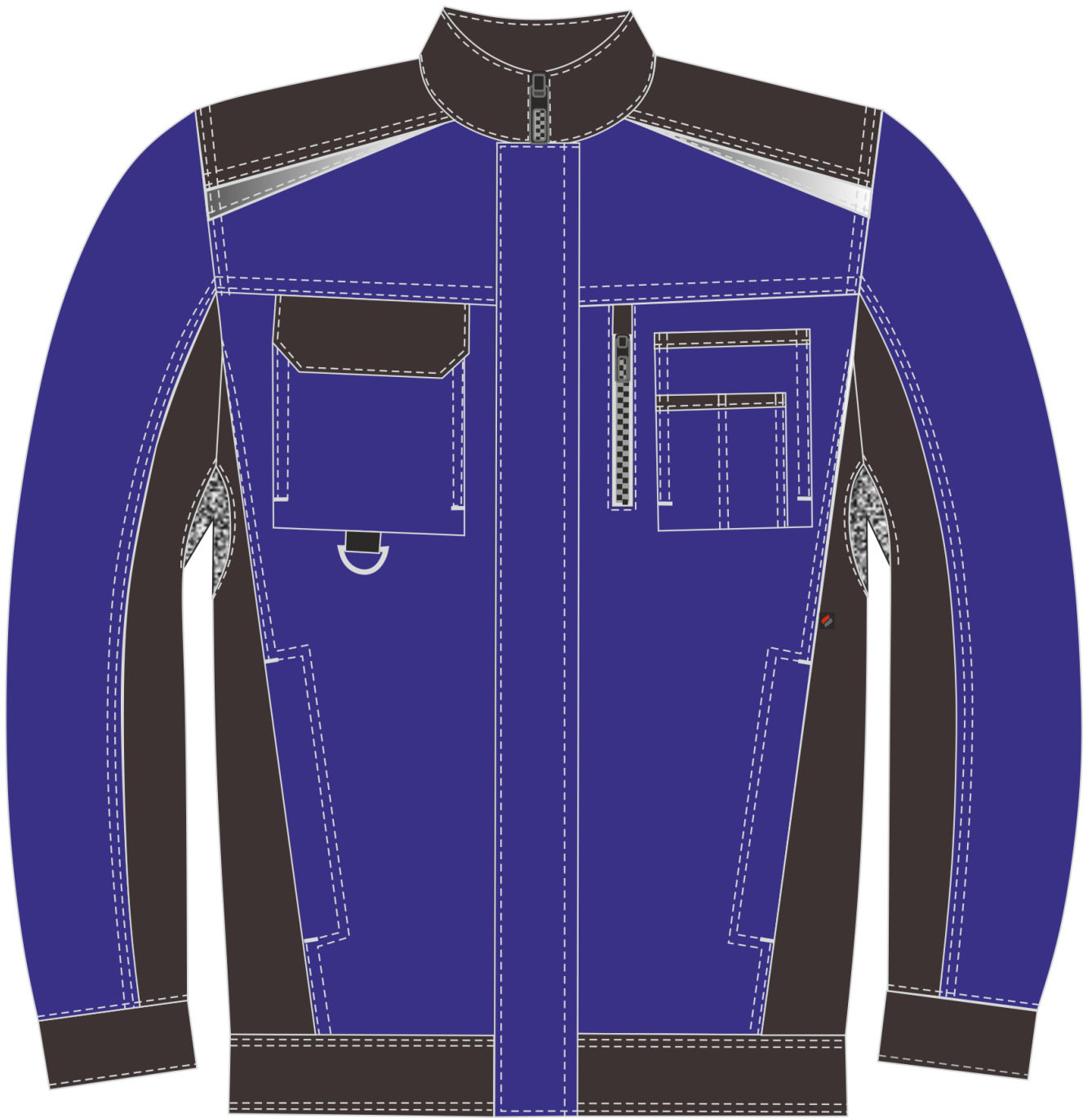
Рис.7. Эскиз Костюм Милан (тк.Карелия,260) брюки, васильковый/черный. Куртка, вид спереди.